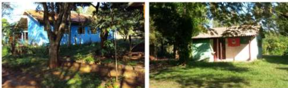
Figura 3: Casas

Cada família desta cooperativa de produção tem a sua própria casa. Como pode ser verificada na figura 3, as casas nesta agrovila não têm cercas, isso para que os moradores tenham uma melhor socialização entre eles, e também pelo fato de significar que é um assentamento coletivo, sem divisão.