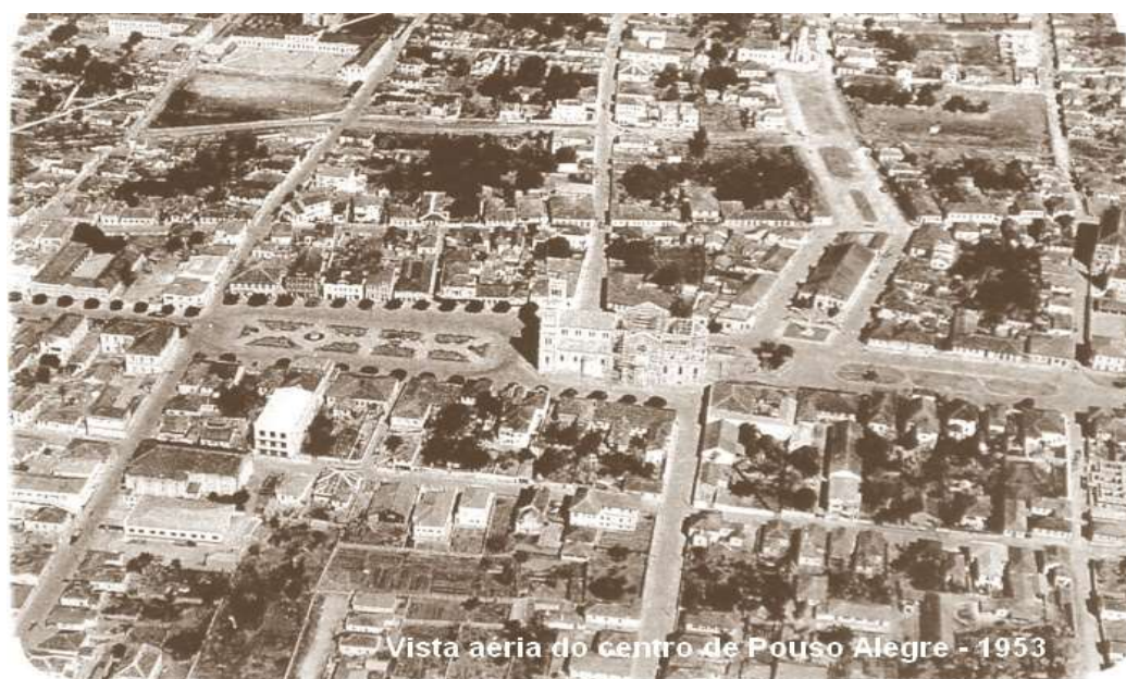
Figura 5 - Vista aérea da cidade - 1953