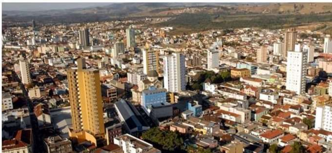
Figura 6 - Vista aérea da cidade - 2009