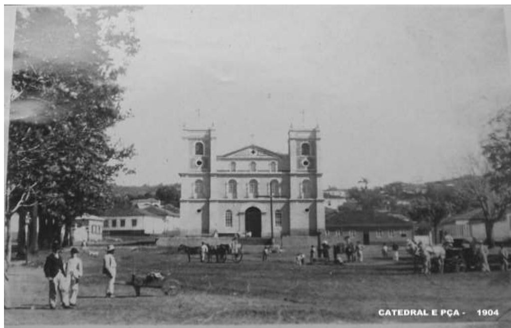
Figura 4 - Catedral e Praça - 1904