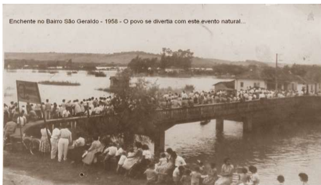
Figura 3 - Enchente no bairro São Geraldo