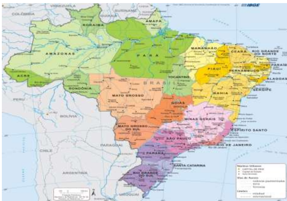
Figura 1 - Representação cartográfica do Brasil