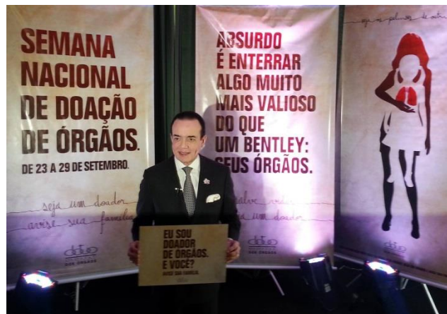
Figura 3 – Chiquinho Scarpa em sua campanha para doação de órgãos.

No decorrer do trabalho algumas campanhas sobre o tema foram citadas, inclusive uma de destaque internacional, que ganhou prêmios, qual seja, a campanha realizada pelo milionário Chiquinho Scarpa, em setembro de 2013, quando ele disse que enterraria seu carro, avaliado na época em mais de Um Milhão de Reais, com o slogan “Absurdo é enterrar algo muito mais valioso do que um Bentley: seus órgãos”.