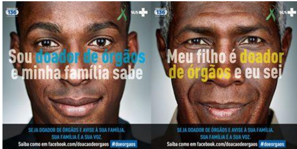
Figura 4 – campanha: seja um doador de órgãos e avise sua família.