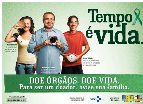
Figura 5 – campanha: seja um doador de órgãos e avise sua família.