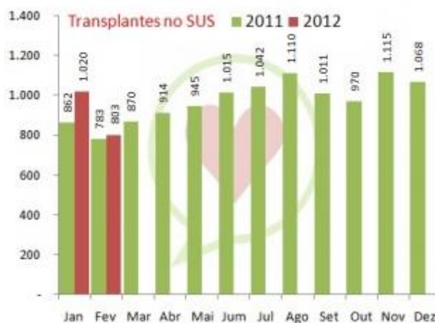
Figura 1 – número de transplantes realizados pelo SUS nos anos de 2011 e 2012