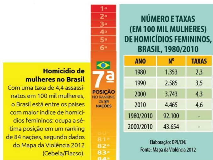
Figura 1: Homicídios femininos

Espera-se verificar a importância da tipificação do feminicídio, como instrumento de garantir a dignidade da pessoa humana, através de uma implementação social de valores, além de analisar a sua qualificadora e hediondez. Para isso conceituar a teoria tridimensional, definir a importância do princípio da dignidade da pessoa humana como vetor axiológico da valoração normativa e apontar os critérios de validade axiológica da norma. Contudo é necessário destacar a proteção do bem jurídico-penal, os fragmentos de ofensividade e a razão da proteção de gênero. Identificar a eficácia da normativa sob o enfoque das políticas públicas., além de elaborar de um parecer crítico de embasamento doutrinário sobre a criminalização do crime feminicídio como qualificadora no crime de homicídio sob a ótica do Direito como instrumento de implementação dos valores corolários da Dignidade Humana. Ainda, Demonstrar as mulheres que é necessário que elas façam a sua parte no enfrentamento à violência doméstica e ao feminicídio, para que assim a norma se torne eficaz para toda uma sociedade.