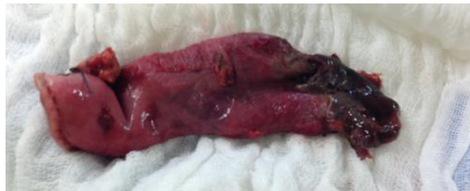
Figura 2: Coto gástrico necrótico