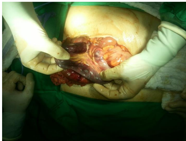
Figura 4 – Alça de delgado isquêmica