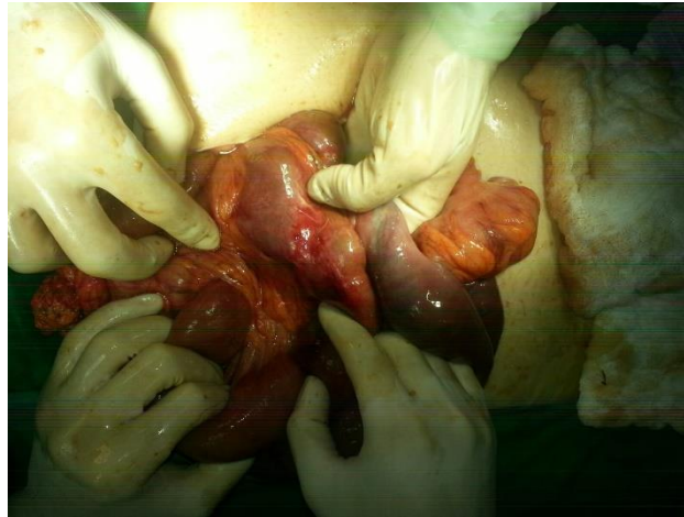
Figura 3 – Anastomose gastrojejunal