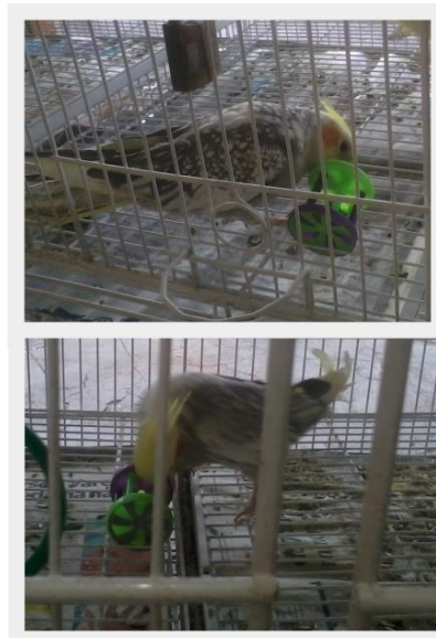
Figura 7 – Fotografias demonstrando interação das aves com roldana

A interação da ave com a roldana foi menor quando comparada às outras medidas de enriquecimento ambiental, sendo observada em um único pet shop (figura 7). Estima-se que, como a roldana permanecia no chão da gaiola, não chamou a atenção das aves como o esperado, apesar das suas cores chamativas. Esperava-se que o brinquedo no chão atraísse os psitacídeos a ponto de que estes se deslocassem, descendo do poleiro para ir até a roldana. Provavelmente se o brinquedo estivesse suspenso, haveria maior interação.