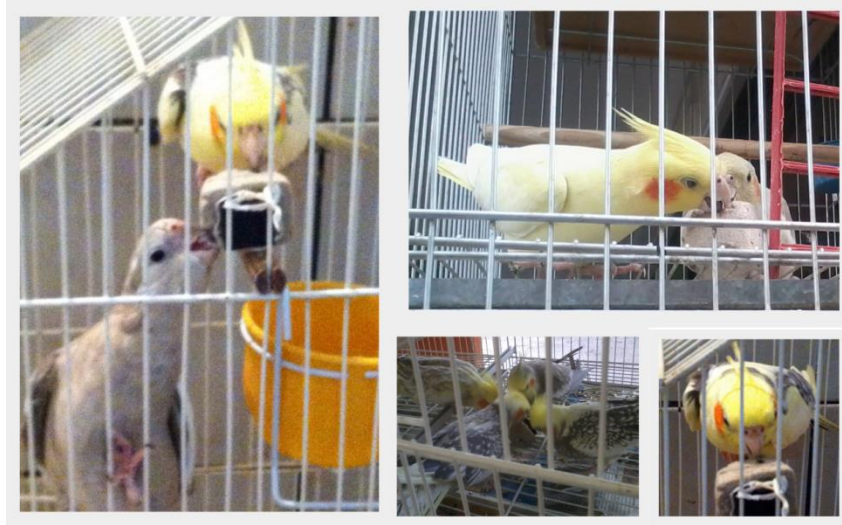
Figura 8 – Fotografias demonstrando interação das aves com bloco de cálcio