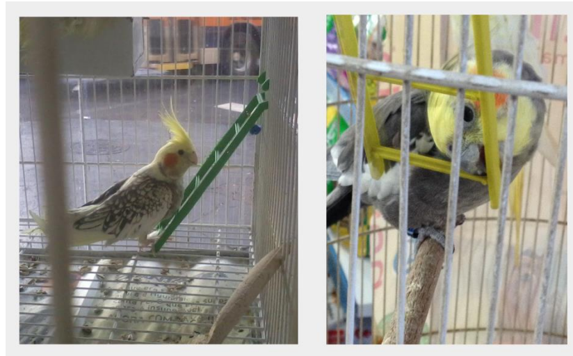
Figura 6 – Fotografias demonstrando interação das aves com escada

A interação da ave com a roldana foi menor quando comparada às outras medidas de enriquecimento ambiental, sendo observada em um único pet shop (figura 7). Estima-se que, como a roldana permanecia no chão da gaiola, não chamou a atenção das aves como o esperado, apesar das suas cores chamativas. Esperava-se que o brinquedo no chão atraísse os psitacídeos a ponto de que estes se deslocassem, descendo do poleiro para ir até a roldana. Provavelmente se o brinquedo estivesse suspenso, haveria maior interação.