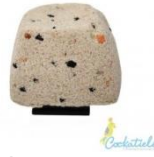
Figura 4 – Bloco de Cálcio para o enriquecimento ambiental