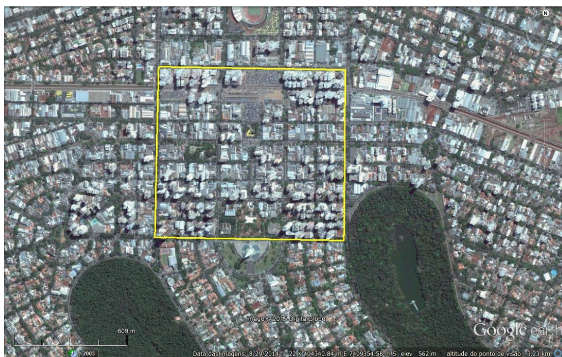
Figura 1 – Região Central de Maringá

A figura 1 representa a região central, onde são encontradas a maioria dos poços tubulares profundos outorgados no município de Maringá. Nas áreas próximas ao Bosque 2 e também ao Parque do Ingá podem ser consideradas de destaque em relação a quantidade de poços, devido ao grande número de outorgas existentes nessa localidade. Já no gráfico 1, observa-se as regiões da cidade com maior número de poços e o acúmulo total entre os bairros, sendo que os números totais de outorgas mencionadas representam 61,7% da totalidade de registros.